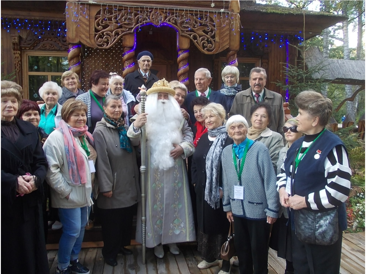
В гостях у белорусского Деда Мороза