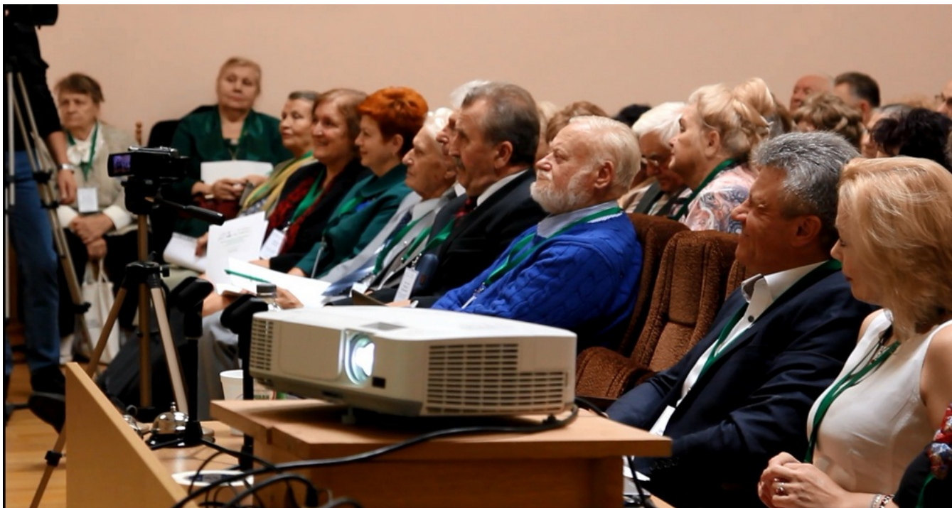
Делегаты с интересом слушают докладчиков