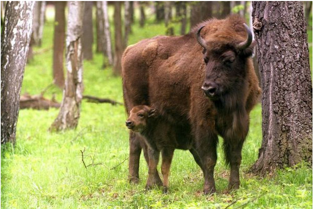
Мать с ребёнком – вечная тема