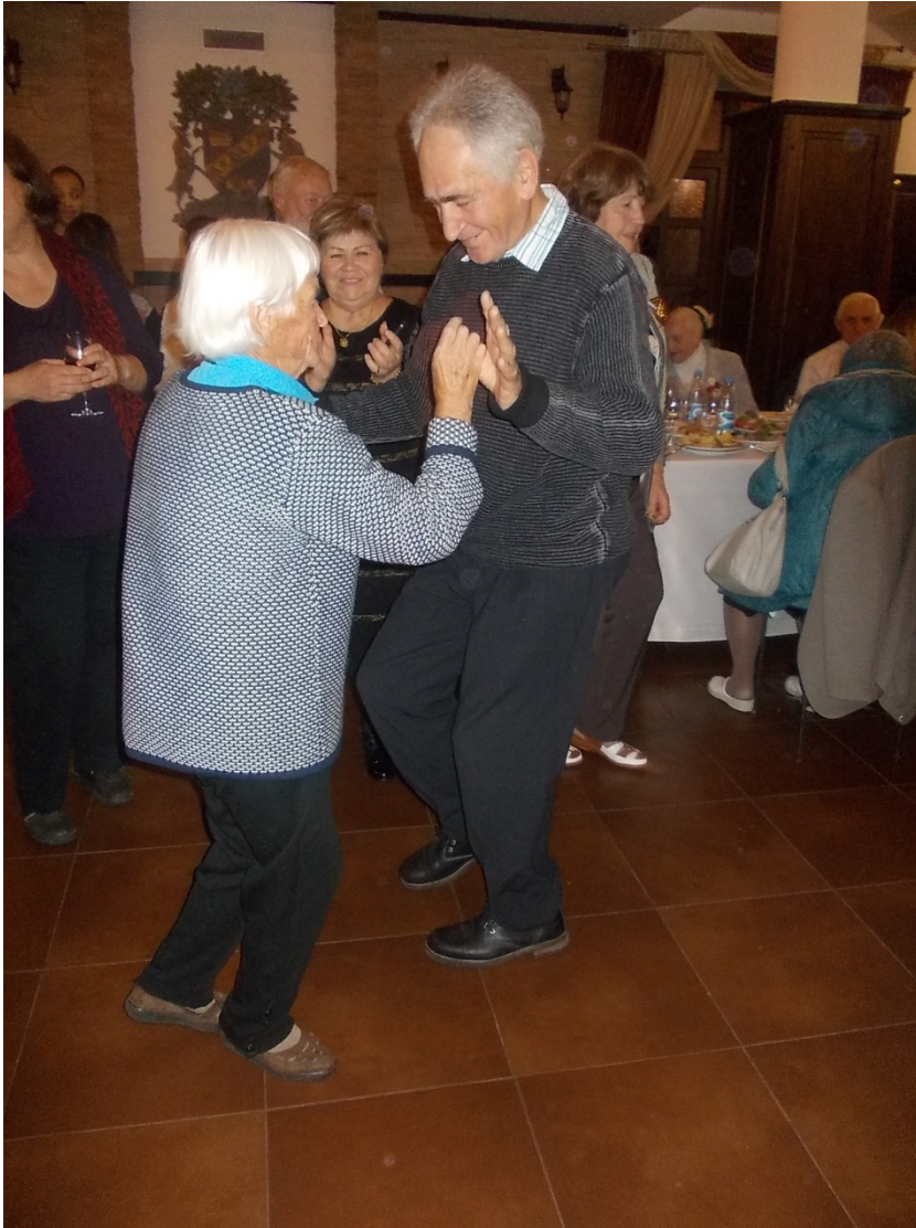
Банкет: делегаты Беларуси и Казахстана

В завершение просто невозможно не вспомнить заповедную зону «Беловежская пуща».