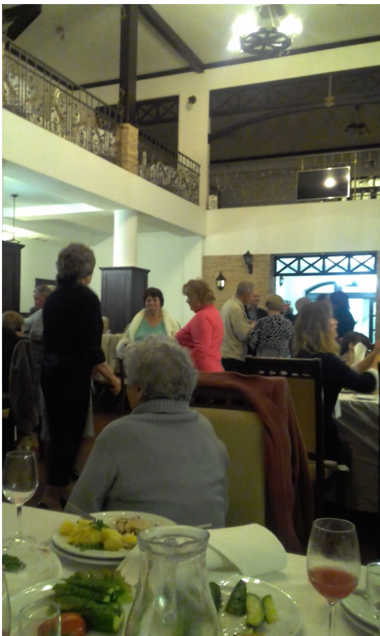
Банкет в честь делегатов Международной конференции