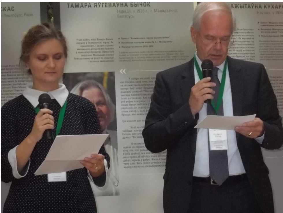
Посол ФРГ в Республике Беларусь г-н П. Деттмар